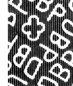
Wasserzeichen 5 Z